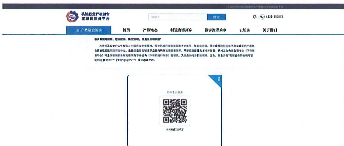
图10 扫码进入填报页面

【试点建设工作申报】→点击【提交试点建设申报此外，也可扫描页面上的二维码，在手机端进行填报，数据实时同步。