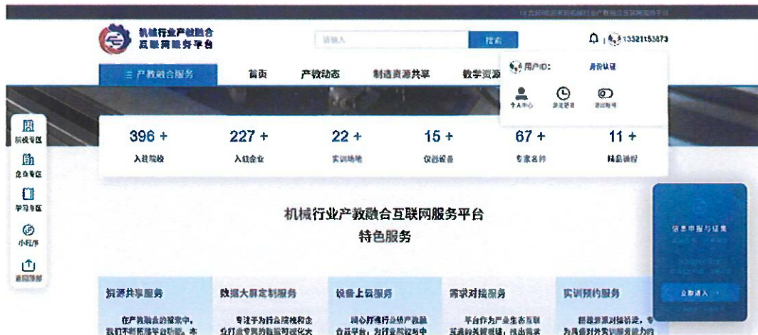
图4 登录成功后的平台首页