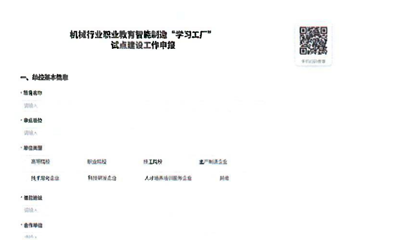
图11 试点建设工作申报问卷页面

点击【提交试点建设申报材料】，即可进入试点建设工作申报问卷页面，请按页面要求完整填写相关内容。