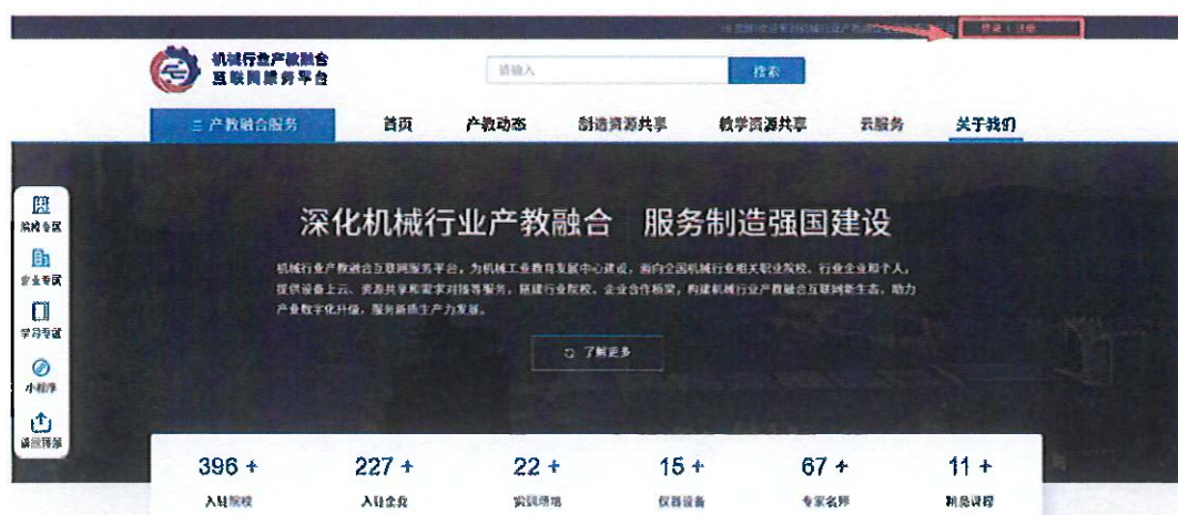
图 1 平台首页右上角登录注册入口

访问平台首页 https://iis.jxcjrc.com ，点击右上角【登录 | 注册】按钮