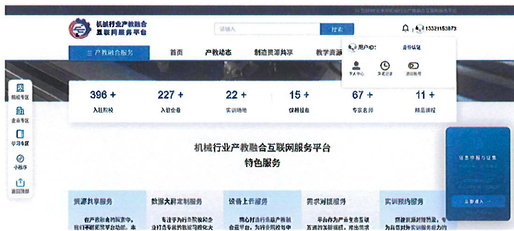
图 8 “信息申报与征集”悬浮窗

完成登录及身份认证后，可按以下步骤进入问卷填写页面： 在平台首页，页面右侧将弹出“信息申报与征集”悬浮窗。