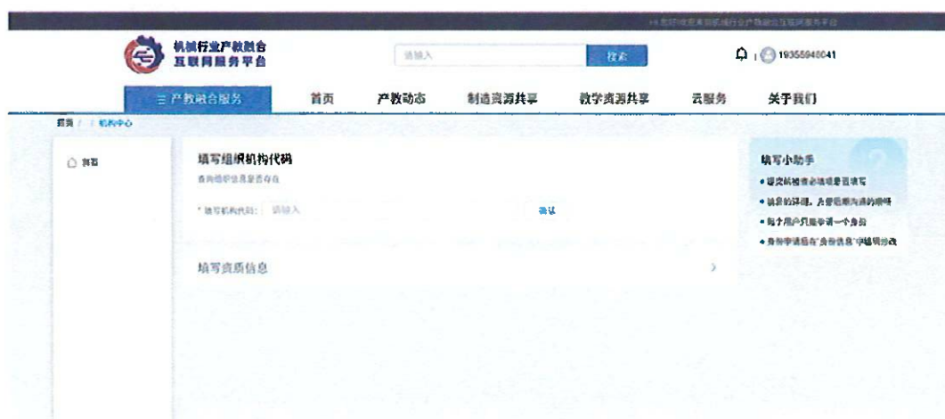
图7 填写组织机构代码页面