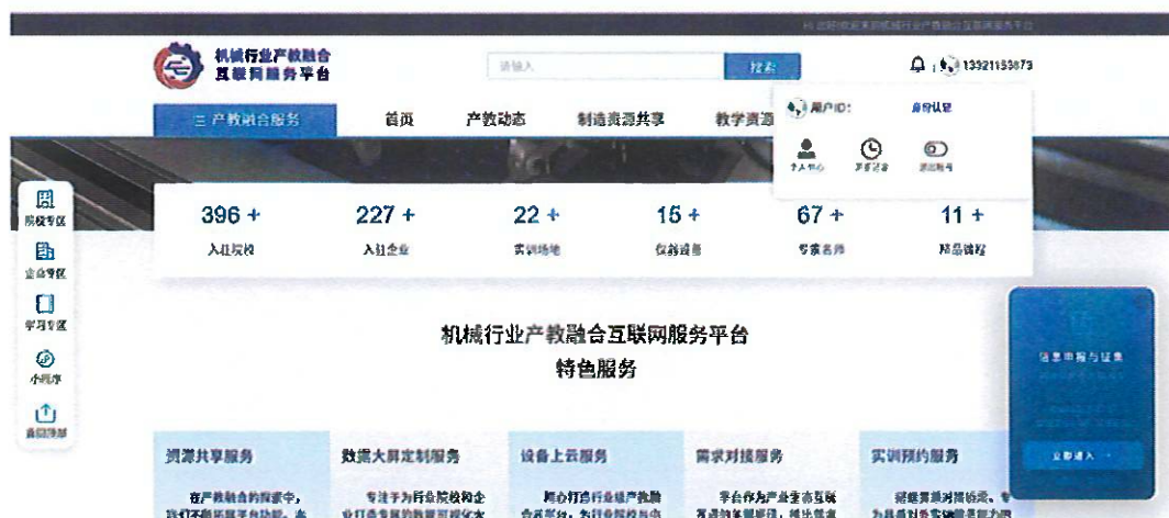
图5 点击用户下拉菜单中的身份认证入口